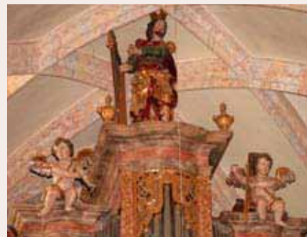
Dreitürmige Prospektkrone mit Barockfiguren: König David mit Leier (Kinnor) und Engel mit Musikinstrumenten