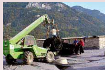
Folienverlegung im hinteren Schlosshof.