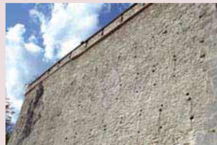
„Süd-West-Bastei“ Schloss Trautenfels, Verpress- und Verankerungsbohrungen.