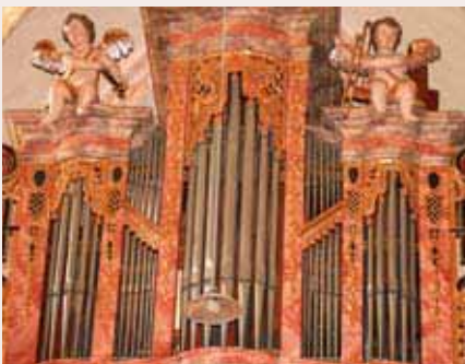
Fünffeldriger Orgelprospekt von Nikolaus Rummel (1754) mit vergoldeten Schleibrettern

Die gegenwärtige Disposition lautet: Manual: C – c '' = 49 Töne