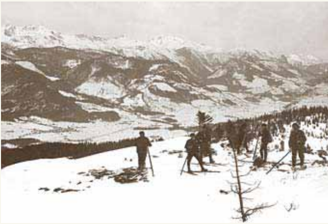
Skipioniere am Hochmühleck, 1909.