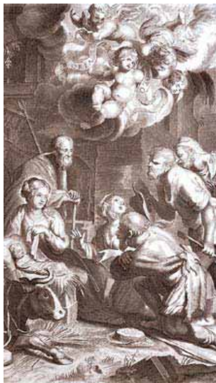
Eine Krippenszene aus der Barockzeit: Das Weihnachtsgeschehen auf dem Kupferstich eines ungenannten Künstlers im Benediktiner-Brevier von 1677 (gedruckt in Kempten im Allgäu).