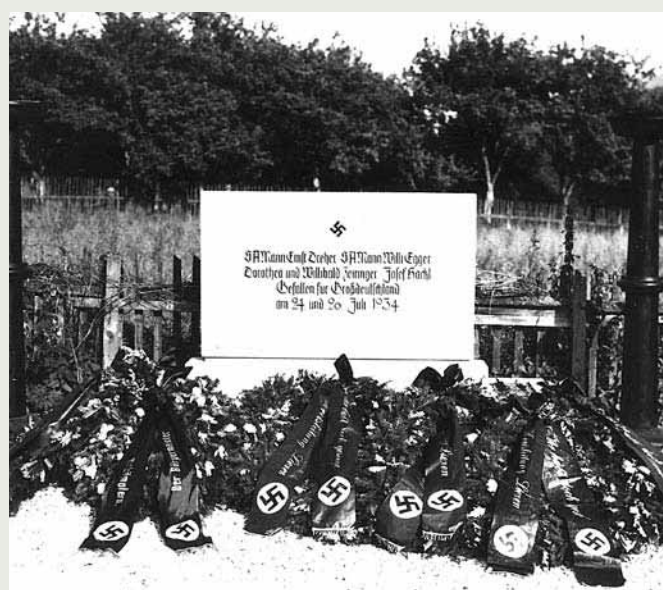
NS-Ehrengrab am alten Liezener Friedhof