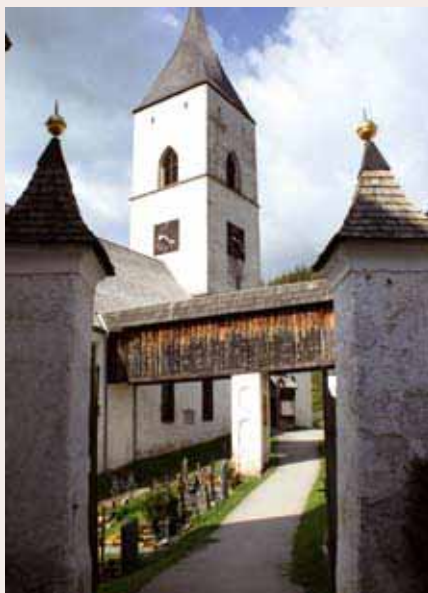
Die 1130 dem Hl. Georg geweihte Pfarrkirche von Pürgg mit wichtigem Turm von 1300.

Im Mittelalter, vor allem im 12. und 13. Jahrhundert, hatte die von den Traungauer Markgrafen errichtete Burg Grausarn 3 die Sicherung dieser Salzstraße über, ehe diese Aufgabe vom Wehrbau Stainach 4 übernommen wurde.