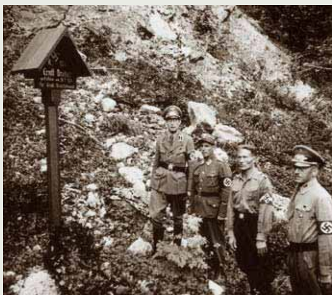
Kranzniederlegung durch NSDAP, SA und HJ am Dreher-Mahnmal

Der Herstellung der Stacheldrahtkugeln in der Schule folgten Arbeitstage am Pyhrn, in denen die SchülerInnen die von der ALWA Forstverwaltung gespendeten Stämme entrindeten und den geplanten Ausstellungsraum adaptierten. Ein Interessenskonflikt zwang zuletzt zur Versetzung des Mahnmals vom Kalkofen auf die Passhöhe. Förderungen des BMUKK und der steirischen Landeskulturabteilung, sowie die tatkräftige Unterstützung der Gemeinden Liezen und Spital am Pyhrn, deren Bürgermeister regen Anteil am Projekt nahmen, ermöglichten den Transport und die Aufstellung der Stämme mit Hilfe schwerer Baufahrzeuge.