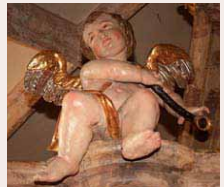
Engel mit krummem Zink (Cornetto curvo)

Der Prospekt 10 der Pürgger Orgel gliedert sich in einen höheren Mittel-turm, der deutlich aus der Frontlinie heraustritt, und zwei tiefer gestufte