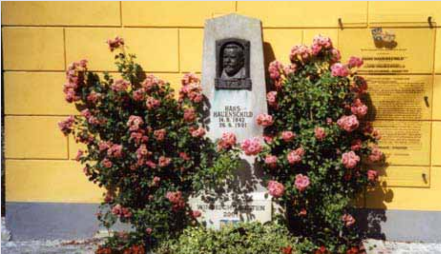
Hauenschilds Grabstein als Denkmal in Windischgarsten.