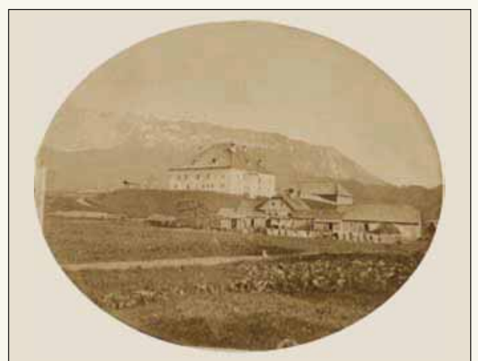
Schloss Grubegg um die Jahrhundertwende (19./20. Jh.).