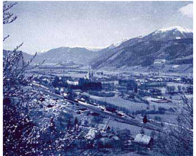
Admont in den 1920er-Jahren (Blick von Südosten), aufgenommen von dem Admonter Fotografen Conrad Fankhauser. „Kunstbeilage“ zur Druckausgabe des Romans „Der Stiftsherr von Admont“.

Stimmung solchermaßen recht schön zum Ausdruck gebracht, doch vergisst der Autor auch nicht, auf die um diese Jahreszeit gewöhnlich herrschende Witterung hinzuweisen: Das neue Kirchenjahr begann grau und düster. Es war die rechte Adventstimmung draußen in der Natur. Schwere Nebel, die bis ins Tal herunterhingen, verdeckten die Sonne, nach der sich alles sehnte. Die Natur fror, denn es fehlte ihr die belebende Wärme.