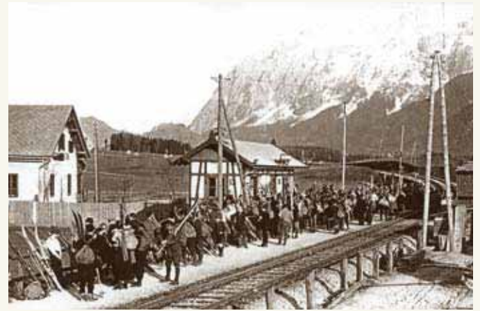
Schiläufer am Mitterndorfer Bahnhof, 1914.

in der Landwirtschaft Erwerbstätigen sank rapide (Jahrhundertwende: noch rund 50%, 1960er Jahre: 10%). Holz- und Forstwirtschaft wurden in der zweiten Hälfte des 20. Jahrhunderts durch einen Tourismusboom als wesentlicher Wirtschaftsfaktor abgelöst - ein Boom, der bis in die 1980er Jahre angehalten hat.