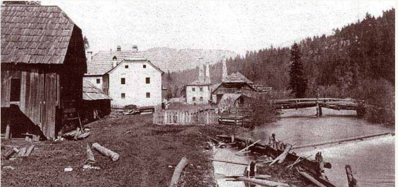
Eisenhammergelände Grubegg, um 1880.

zung. Eine weitere bemerkenswerte Tatsache ist, dass diese Sagen einen sehr großen Teil des ostalpinen Sagenreportoires umfassen, viele der bekannten Sagen des Ostalpenraumes sind somit auch in einer Hinterberger Variante überliefert.