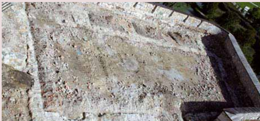
Mauerreste im Bereich der „Nord-Ost-Bastei“.