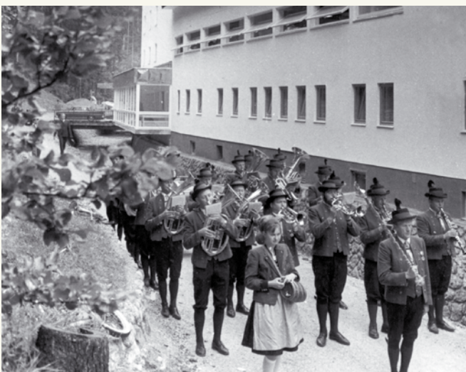
Eröffnungsfeier Bad Heilbrunn, 1967.

Flurdenkmäler begegnen uns als hölzerne oder auch steinerne Zeugen von