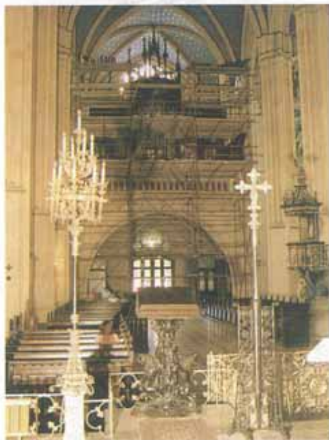
Skele za obnovu orgulja 1985. – 1987.