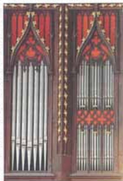
Svirale na orguljama

1647.) i Kaptol povjeravaju 1647. graditelju Grgi Štruglu izgradnju novih orgulja za katedralu, uz cijenu od 1100 zlatnih škuda. Te nove orgulje dao je Bogdanov