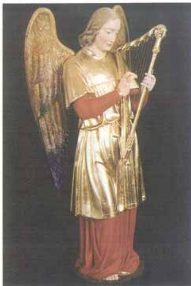
Andeo s harfom na pročelju orgulja