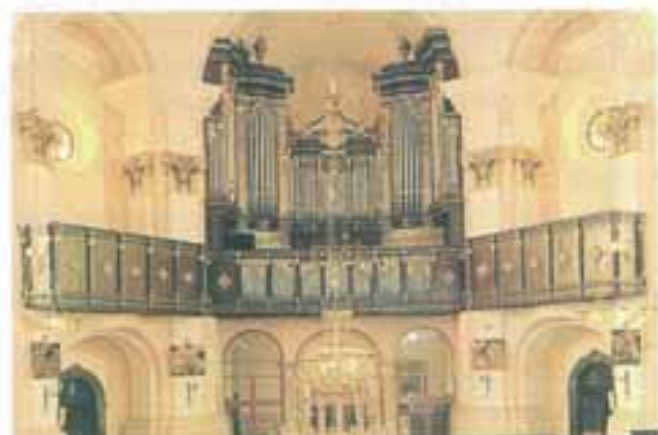
Orgulje zagrebačke katedrale izgrađene u Pečuhu 1834. Sada u župnoj crkvi u Pregradi

U ovoj svečanoj prigodi kolaudacije, usmjerit ćemo svoj pogled na prošlost i sadašnjost orgulja u zagrebačkoj prvostolnici. O njima nam govore drevne listine Kaptolskog arhiva, kao i objavljeni radovi, osobito od kanonika Janka Barléa, katedralnog orguljaša Vatroslava Kolandera, zatim Božidara Širole i Franje Dugana do svećenika Subotičke biskupije Josipa Mioča u novije vrijeme.