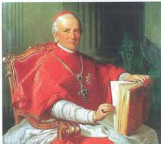
Nadbiskup Juraj Haulik - naručitelj orgulja