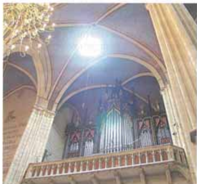
Obnovljene orgulje – 2005.

Današnje orgulje naše prvostolne crkve zagrebačke savršeno su djelo orguljarskog umijeća. Najveće su orgulje jugoistočno od Beča, a po umjetničkoj vrijednosti jedne od vrjednijih u Europi. One, evo, traju već 150 godina. Dostojno je, da nam o svom visokom jubileju 150. obljetnice, vezano uz 150. obljetnicu Zagrebačke nadbiskupije i metropolije, zazvuče obnovljene i osvježene! Svima srdačno zahvaljujem!