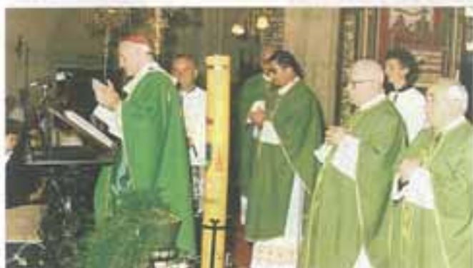
Kardinal Franjo Kuharić blagoslivlje orgulje 5. srpnja 1987.