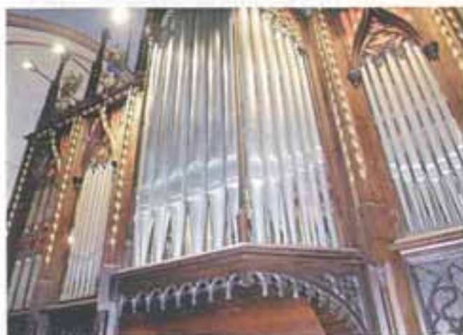
Svirale na orguljama