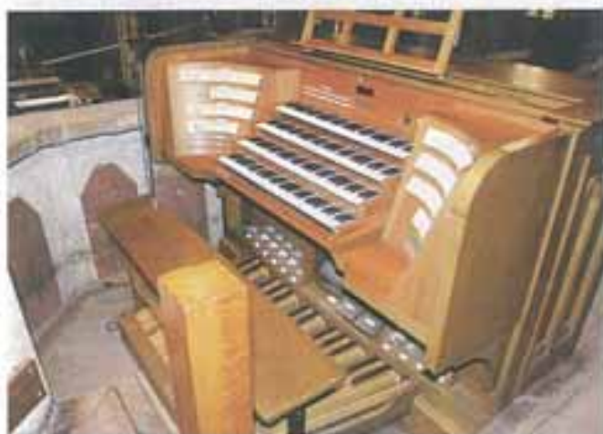
Sviraonik zagrebačkih orgulja